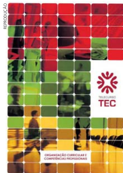
Apostilas dos cursos disponíveis para download

Telecurso TEC oferece, com supervisão do Centro Paula Souza, três opções gratuitas de formação pela internet