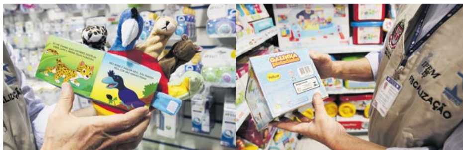
Falta de Selo do Inmetro: uma das irregularidades verificadas durante a fiscalização

Rigor – Quando há suspeita de irregularidade em algum produto, a fiscalização apreende o estoque existente na loja e o responsável tem prazo de dez dias