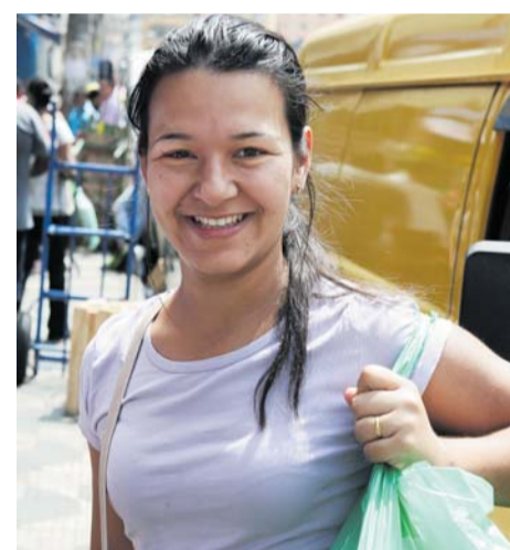
Alessandra elogiou a iniciativa do Ipem-SP

úteis para apresentar defesa no Ipem-SP. Confirmada a irregularidade, a multa varia de R$ 800 a R$ 30 mil. O valor da autuação dobra em caso de reincidência.