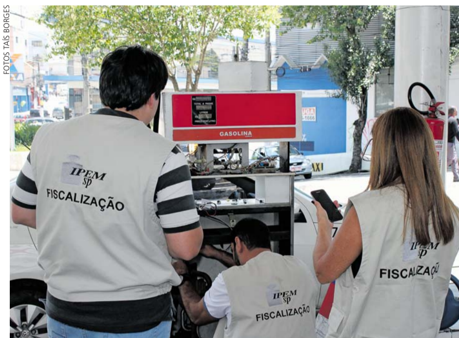
Fiscais localizaram irregularidades em 142 bombas de gasolina

Defesa – Os postos autuados são de Campinas (4), Diadema (2),