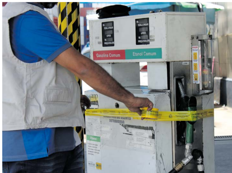
Detectada a irregularidade, a bomba de gasolina é lacrada

Guarujá (1), Mongaguá (1), Praia Grande (2), Ribeirão Preto (2), Santo André (2), Santos (1), São Bernardo do Campo (2), São Paulo (1) e São Vicente (1). Os proprietários têm dez dias para apresentação de defesa no Ipem-SP. O nome e o endereço dos estabelecimentos estão disponíveis para consulta no site do Ipem-SP ( ver serviço ).