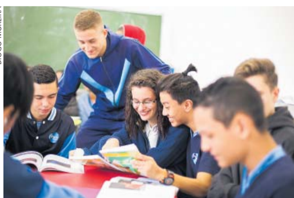
Educação paulista – 1º lugar no ranking do atendimento

Além de ocupar o primeiro lugar no ranking do atendimento, a educação paulista também tem posição de destaque nas avaliações sobre a qualidade do ensino. Na última edição do Índice de Desenvolvimento da Educação Básica (Ideb), aplicada em 2015, a rede estadual aparece na primeira posição nos três ciclos de análise: 5º e 9º anos do ensino fundamental ( http://www.educacao.sp.gov.br/ensino-fundamental ) e 3ª série do ensino médio.