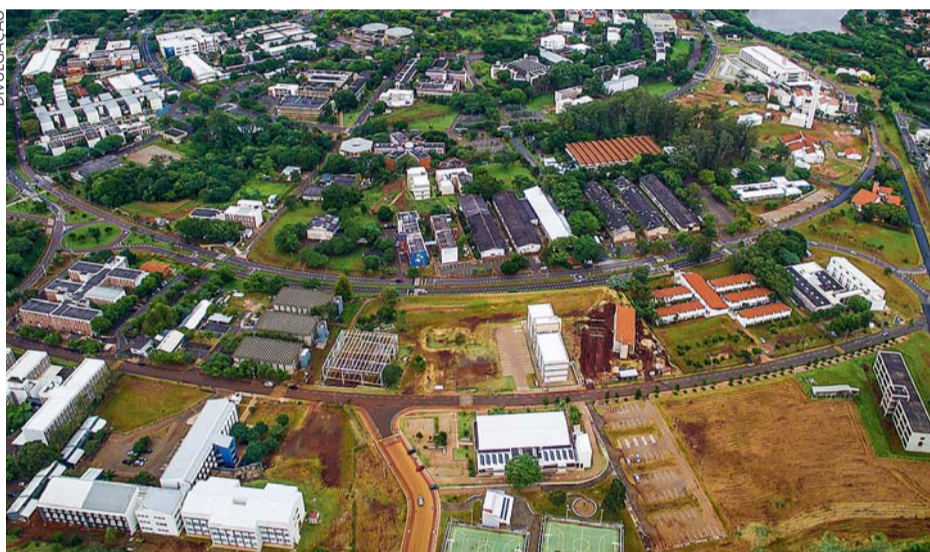
Avaliação – Ranking da Times Higher Education analisa 13 indicadores de desempenho

Esta é a segunda edição no continente do ranking anual realizado por revista britânica especializada em avaliar instituições de ensino superior; USP ficou em 2º lugar