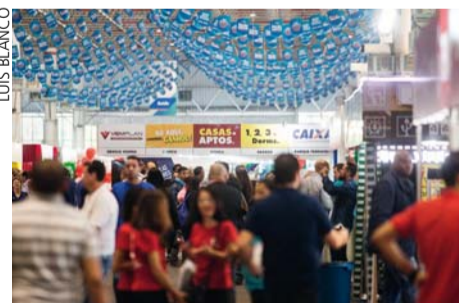
Oportunidade – Evento ocorre até o dia 22

O valor do subsídio dependerá da composição da renda familiar e da região metropolitana onde o imóvel se localiza. Para ter acesso ao subsídio, os servido-