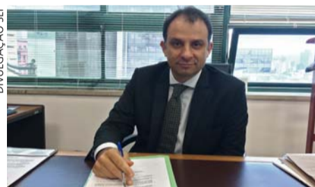
Carvalho: “Facilitar o acesso ao benefício”

A partir de agora, o beneficiário envia pelo site do Sistema de Controle de Pedidos de Benefícios Fiscais para Veículos Automotores (SIVEI) os documentos exigidos e não precisa mais ir até um posto fiscal para fazer a solicitação. “Pretendemos acelerar o processo e facilitar a um cadeirante, por exemplo, o acesso ao benefício”, explica Carvalho.